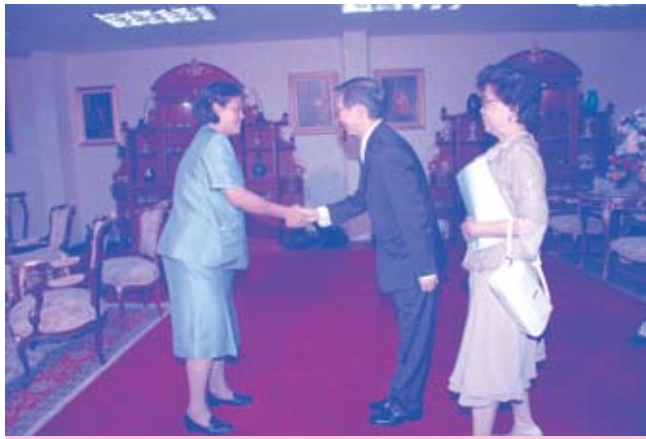
พระราชทานพระราชวโรกาสให้เอกอัครราชทูตเข้าเฝ้าฯ ณ อาคารชัยพัฒนา (๑๖ เมษายน ๒๕๕๒)