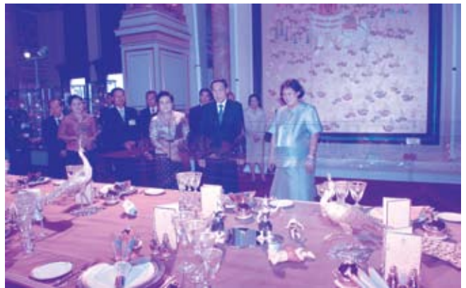
ทรงนำประธานประเทศสาธารณรัฐประชาธิปไตยประชาชนลาวและภริยาชมนิทรรศการศิลปะแผ่นดิน (๑๓ พฤษภาคม ๒๕๕๒)