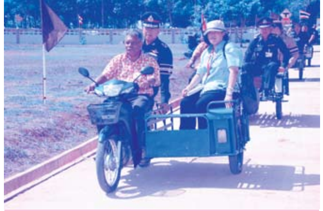
เสด็จฯ ไปทรงปฏิบัติพระราชกรณียกิจ ณ เกาะหลีเป๊ะ จังหวัดสตูล (๔ มีนาคม ๒๕๕๒)

เวลา ๑๑.๒๐ น. โดยเสด็จ สมเด็จพระบรมโอรสาธิราชฯ สยามมกุฎราชกุมาร เสด็จฯ แทนพระองค์ไปทรงส่งเสด็จสมเด็จพระราชาธิบดีและสมเด็จพระราชินีแห่งมาเลเซีย ณ กองบัญชาการกองทัพอากาศ ดอนเมือง