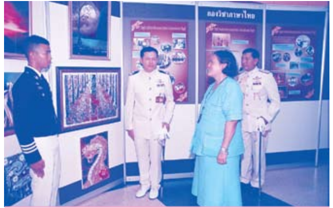
ทรงเปิดพิพิธภัณฑสถานโรงเรียนเตรียมทหาร ณ สโมสรโรงเรียนเตรียมทหาร จังหวัดนครนายก (๖ พฤษภาคม ๒๕๕๒)

เวลา ๑๗.๓๐ น. โดยเสด็จ พระบาทสมเด็จพระเจ้าอยู่หัวและสมเด็จพระนางเจ้าฯ พระบรมราชินีนาถ เสด็จฯ ไปในการพระราชพิธีสมโภชพระมหาเศวตฉัตร และเครื่องสิริราชกกุธภัณฑ์ เนื่องในการพระราชพิธีฉัตรมงคล ณ พระที่นั่งอมรินทรวินิจฉัย