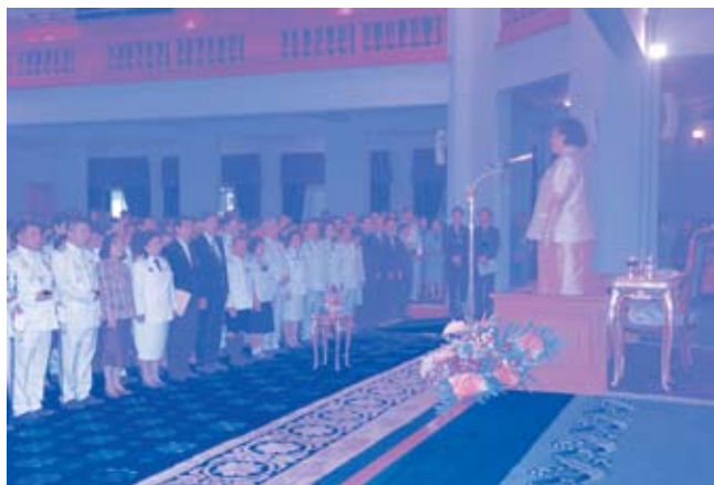
พระราชทานพระราชวโรกาสให้คณะครูใหญ่โรงเรียน ตชด. เฝ้าฯ ณ ศาลาดุสิดาลัย (๒๐ เมษายน ๒๕๕๒)