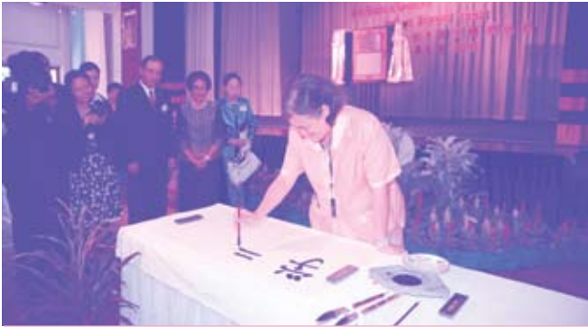
ทรงเปิดห้องเรียนขงจื้อ ณ โรงเรียนจิตรลดา (๑๒ มิถุนายน ๒๕๕๒)