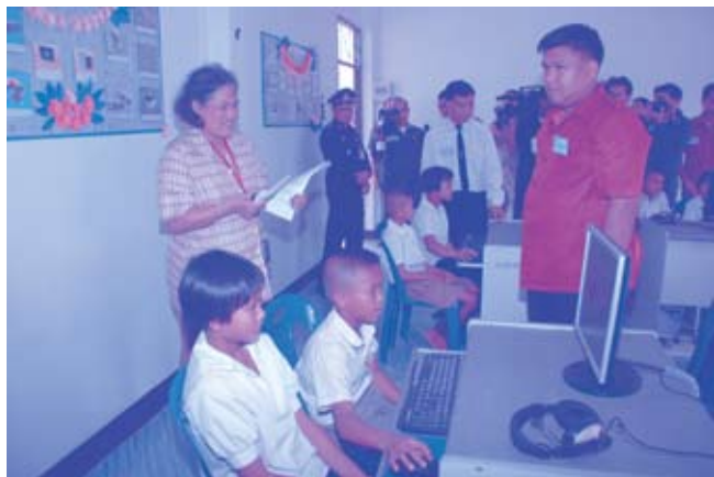
เสด็จฯ ไปทรงเยี่ยมโรงเรียน ตชด. ในจังหวัดอุบลราชธานี (๑๒ กุมภาพันธ์ ๒๕๕๒)