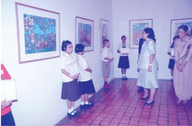
ทรงเปิดนิทรรศการศิลปกรรมนำสิ่งที่ดีที่สุด ณ พิพิธภัณฑ์สถานแห่งชาติ (๖ พฤษภาคม ๒๕๕๑)