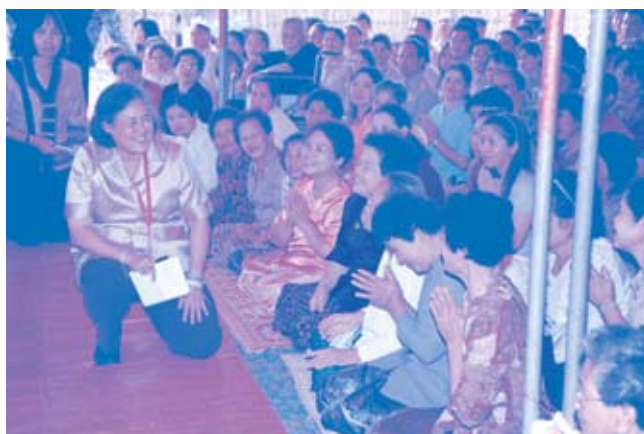
เสด็จฯ ไปทรงเยี่ยมราษฎรในจังหวัดเชียงราย (๑๖ กุมภาพันธ์ ๒๕๕๒)