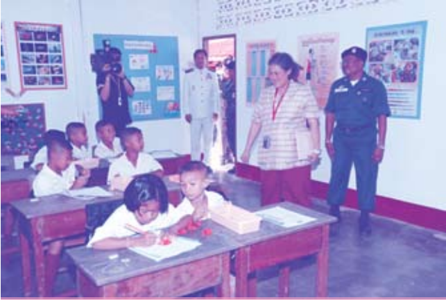
เสด็จฯ ไปทรงเยี่ยมโรงเรียน ตชด. ในจังหวัดตรัง (๖ มกราคม ๒๕๕๒)