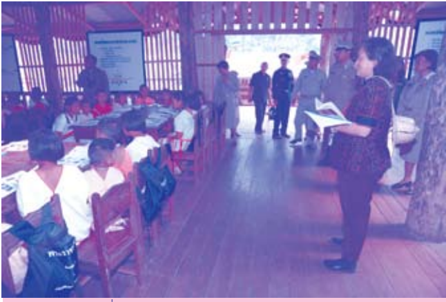
เสด็จฯ ไปทรงเยี่ยมศูนย์การเรียนรู้ชุมชนชาวไทยภูเขาแม่ฟ้าหลวง อำเภออุ้มผาง จังหวัดตาก (๑๗ ธันวาคม ๒๕๕๑)