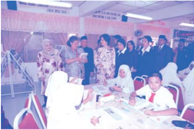
เสด็จฯ ไปทรงปฏิบัติพระราชกรณียกิจ ณ เกาะหลีเป๊ะ จังหวัดสตูล (๓ มีนาคม ๒๕๕๒)