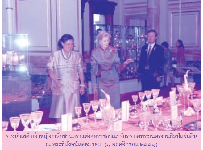
ทรงนำเสด็จเจ้าหญิงเล็กชานดราแห่งสหราชอาณาจักร ทอดพระเนตรงานศิลป์แผ่นดิน ณ พระที่นั่งอนันตสมาคม (๘ พฤษภาคม ๒๕๕๑)