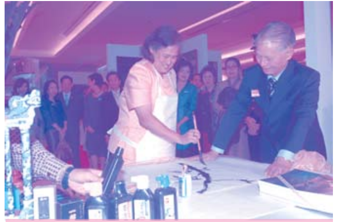
เสด็จฯ ไปทรงเปิดงานนิทรรศการจิตรกรรมตะวันออกสมัยใหม่ ณ ศูนย์การค้าสยามพารากอน (๑๙ ธันวาคม ๒๕๕๑)