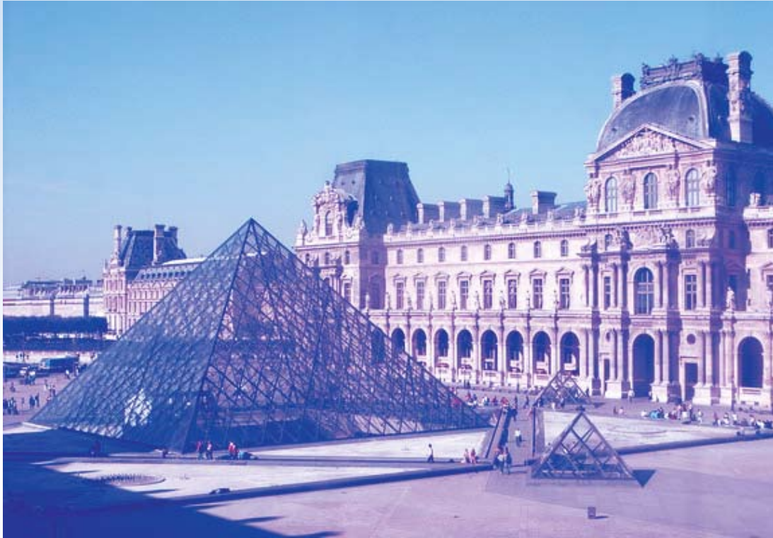
พิพิธภัณฑ์ลูฟวร์ (The Louvre Museum) กรุงปารีส สาธารณรัฐฝรั่งเศส

ในทวีปยุโรประหว่างปลายศตวรรษที่ ๑๘ และปลายศตวรรษที่ ๑๙ พิพิธภัณฑ์สำหรับสาธารณชนได้พัฒนารูปแบบมาเป็นแบบที่ผู้คนคุ้นเคยในปัจจุบัน มีการปรับเปลี่ยนหลักปฏิบัติของสถาบันที่เก็บสิ่งของที่มีมาก่อนหน้านี้ และปรับเปลี่ยนลักษณะของสถาบันแห่งใหม่อย่างสร้างสรรค์ อาทิ งานนิทรรศการนานาชาติ และห้างสรรพสินค้า ซึ่งได้พัฒนาไปพร้อมๆ กับพิพิธภัณฑ์ ในช่วงเวลานั้น กวีและศิลปินเป็นบุคคลที่ให้ความสนใจต่อพิพิธภัณฑ์ทางศิลปะ ไม่ว่าจะเป็นการสนับสนุนหรือต่อต้านแนวความคิดของพิพิธภัณฑ์ก็ตาม ระหว่างที่ศตวรรษที่ ๑๙ ได้ดำเนินไป ผู้เข้าชมพิพิธภัณฑ์อย่างจริงจังที่เล็งเห็นถึงความสำคัญของพิพิธภัณฑ์ทางศิลปะได้ขยายตัวขึ้นอย่างมาก ภายในปลายศตวรรษที่ ๑๙ แนวความคิดของพิพิธภัณฑ์ทางศิลปะในฐานะของสถานที่ที่เต็มไปด้วยประสบการณ์ที่มหัศจรรย์และเปลี่ยนรูปแบบได้กลายเป็นเรื่องที่เกิดขึ้นในทวีปยุโรปและอเมริกา