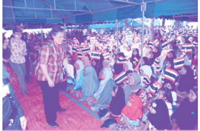
เสด็จฯ ไปทรงเยี่ยมราษฎรในจังหวัดปัตตานี (๗ มกราคม ๒๕๕๒)